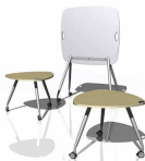
Möbel und Inneneinrichtungen