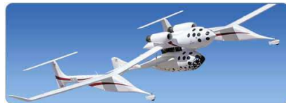
Space Ship One Für die Entwicklung dieses revolutionären Raumschiffs wurde Ashlar Vellum Cobalt eingesetzt.